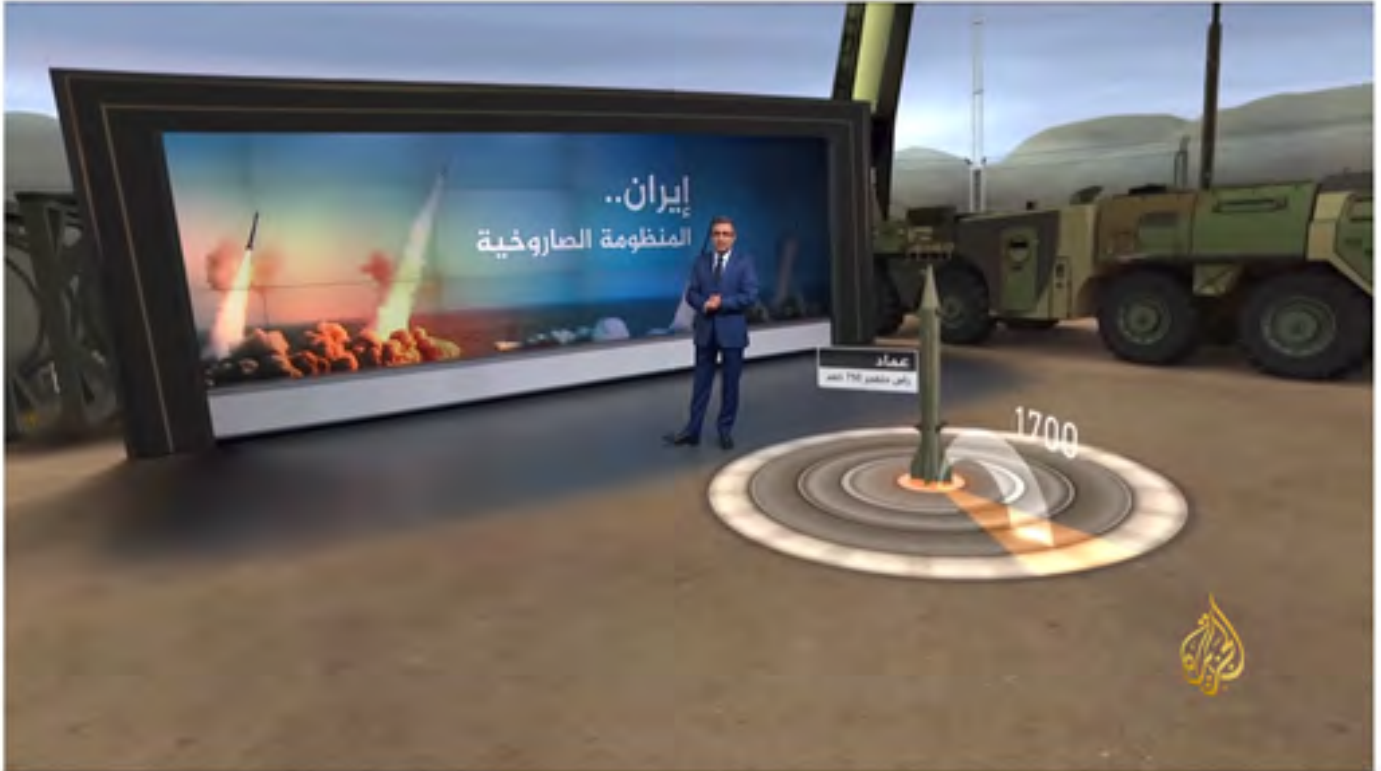
تعرف على المنظومة الصاروخية الإيرانية 18

تقرير: تعرف على المنظومة الصاروخية الإيرانية | قناة الجزيرة 33