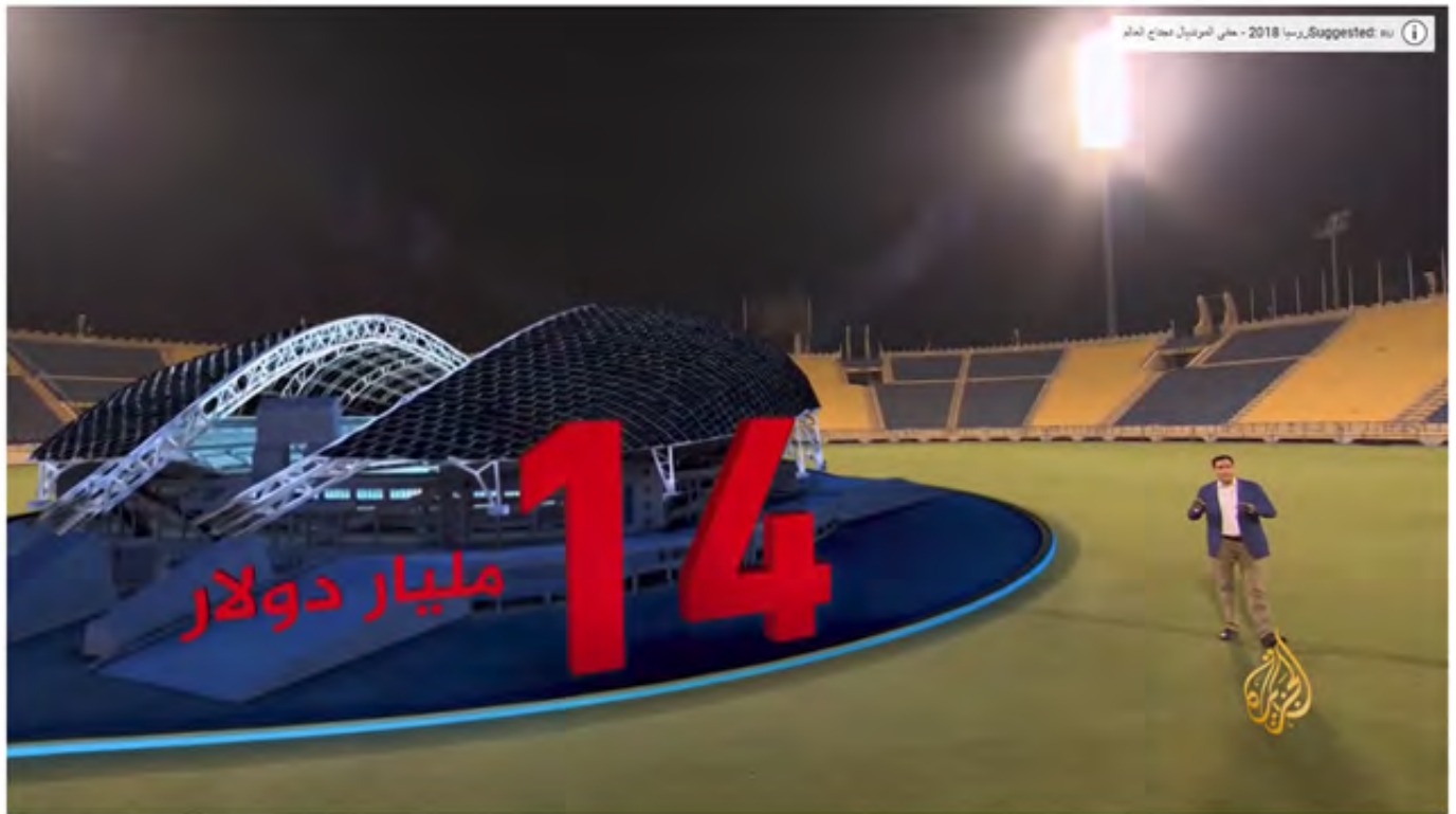
ماذا سترى النول المستصلحة تكأس العالم؟