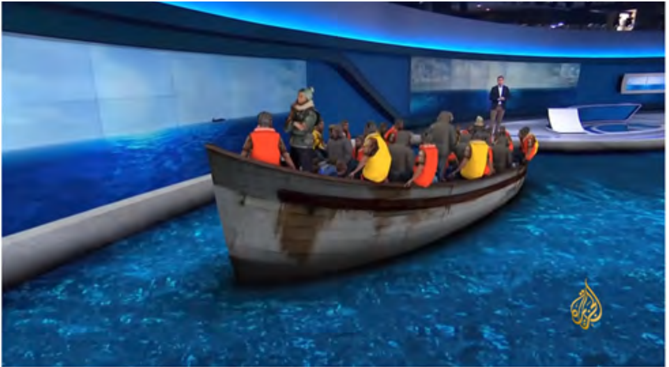
رحلة الموت لأوروبا.. معاناة المهاجرين بحثا عن الكرامة والأمان 3,465 views

مرحلة التخطيط: وهي المرحلة التي يقوم فيها المنتج