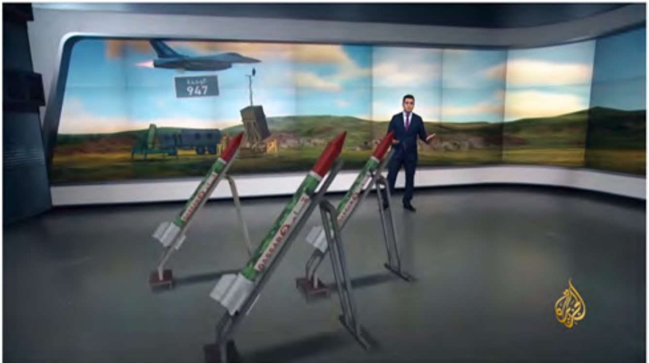
تقرير: منظومة القبة الحديدية الإسرائيلية وأماكن انتشارها | قناة الجزيرة 31