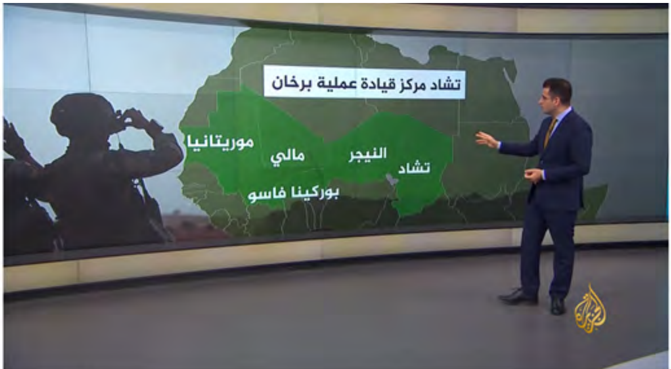
تقرير: القواعد العسكرية الفرنسية بأفريقيا | قناة الجزيرة 32