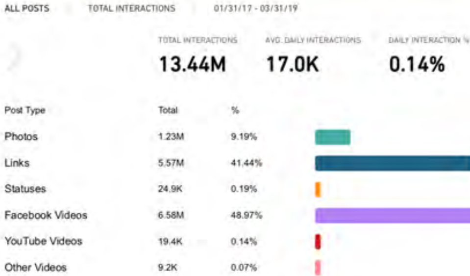
شكل 02 Crowdtangle Intelligence report, Midan Facebook page, 31/01/2017-28/02/2019

شكل رقم (2) يوضح تفاعل جمهور ميدان على فيسبوك مع التقارير المطولة والفيديوهات الرقمية ومتوسط التفاعل ونسبته اليومية