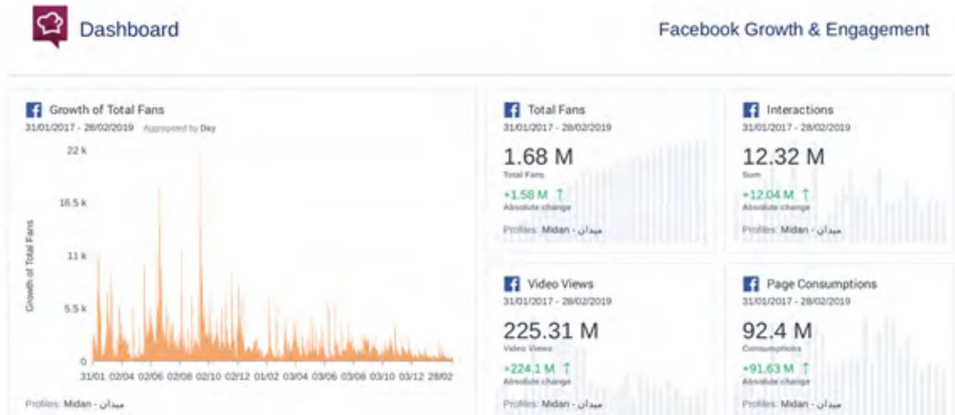
شكل (1) Socialbakers Export Facebook Growth & Engagement, 31/01/2017-28/02/2019 01

شكل رقم (1) يبرز عدد مشاهدات الفيديو الرقمي الطويل على صفحة ميدان في فيسبوك ومجموع تفاعل جمهور الصفحة مع المحتوى